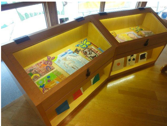
展示ケースに収められたプラハから送られた作品

昨年11月から除染作業のため休館していましたが、4月に一部再オープンを迎え、この夏に絵本カーニバルを開催できることになりました。18年前の開館当初に携わった方も花を携えてお祝いに駆けつけていただきました。