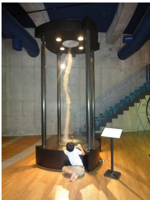
1階の展示装置で遊ぶ子ども

組み立て式の段ボールの本棚を設置しました。運搬がしやすく軽量で簡単に組立ができると館の担当者の方に好評でした。遊びと学びのミュージアム1階アースフロア内に5つのカテゴリー（遊び、宇宙・地球・自然、暮らし、生命・からだ、幼児）で分けられた絵本を置きました。