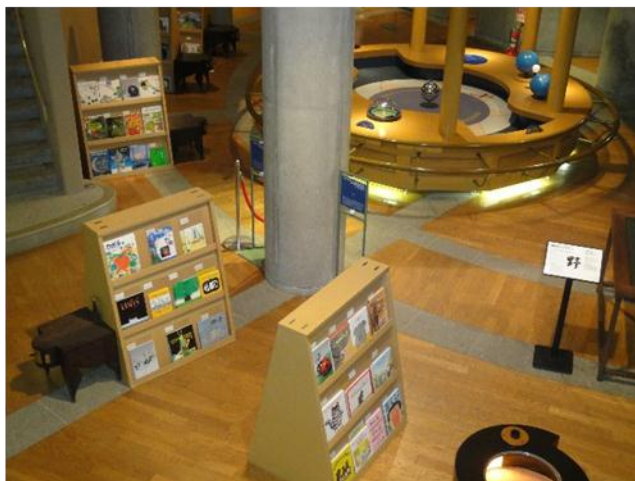
1階フロアのテーマ別に展示された絵本

開館から18年を経た施設とは思えないほどよく整備され、丁寧に使われているハンズオンの展示装置のなか、絵本が並ぶとカラフルな表紙が空間に映え、自然と温かみの溢れる今までとは一味違う魅力ある空間となりました。