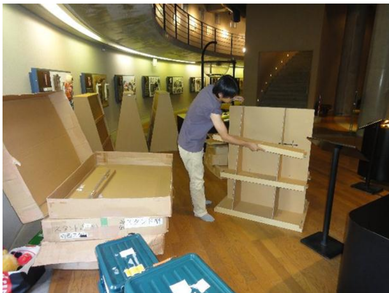
子どもに安心な工具を使わない組立式段ボールの本棚

2012年7月21日から9月2日まで開催される「りょうぜん絵本カーニバル2012」には500冊を超える絵本が展示され、絵本づくりなど様々なワークショップが展開されます。