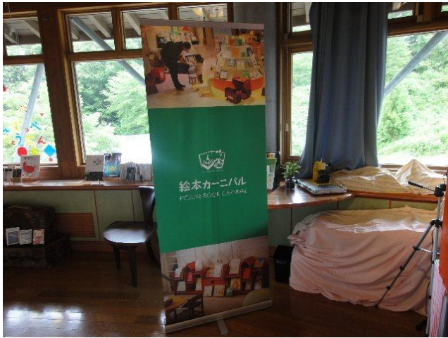
宮沢賢治コーナーと絵本カーニバルのタイトルサイン