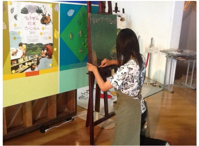
手書きのサインボードにイベントの案内を描くスタッフ